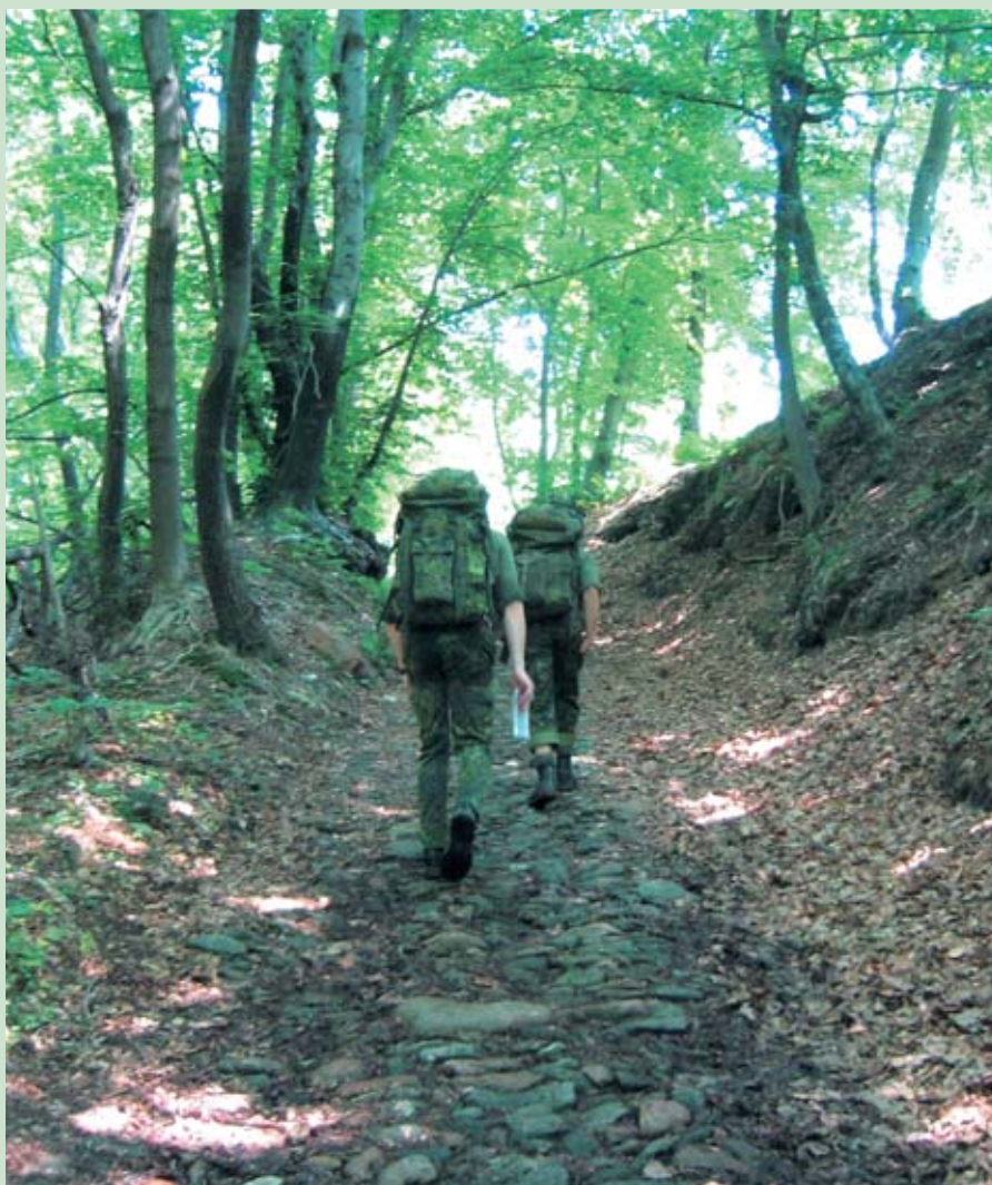
Der skal en del væske til, når temperaturen er over 30 grader og mere end 1000 højdemeter skal passeres over en strækning på minimum 22 kilometer.

Skulle du være interesseret i at deltage i lignede aktiviteter eller være med til den fælles træning, kan du kontakte premierløjtnant-R Esben Buhl på ebuhl2000@yahoo.dk