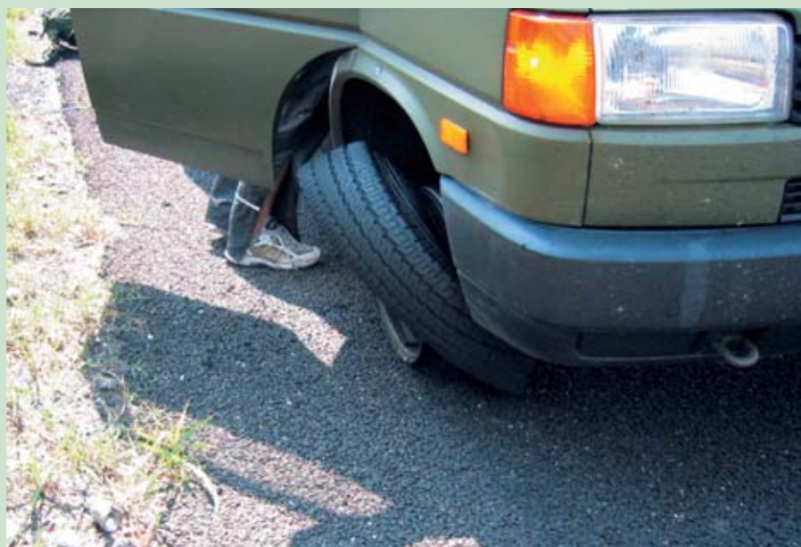
Punktering på vejen sydpå. Lynhurtigt røg vi ind i nødsporet uden at blive ramt af den italienske eftermiddagstrafik.

Selve løbet bestod af en række poster, hvor der var forskellige opgaver der skulle løses. Ved hver post fik patruljen givet et nyt koordinat, som tilkendegav den næste. Formålet med patruljekonkurrencen er at vedligeholde og samtidig opdatere soldatens professionelle evner som reserveofficer. Så i løbet af konkurrencen stødte vi på opgaver med flykending, panserledning, udpegning af mål, mortar, rensning af hus, observation af fjendtlig bevægelse, vandpassage, kommando-kravt, førstehjælp, skydning med både luftpistol- og riffel, men så sandelig også pumpgun, som var en handlebaneskydning på tid. Hvilket nok var