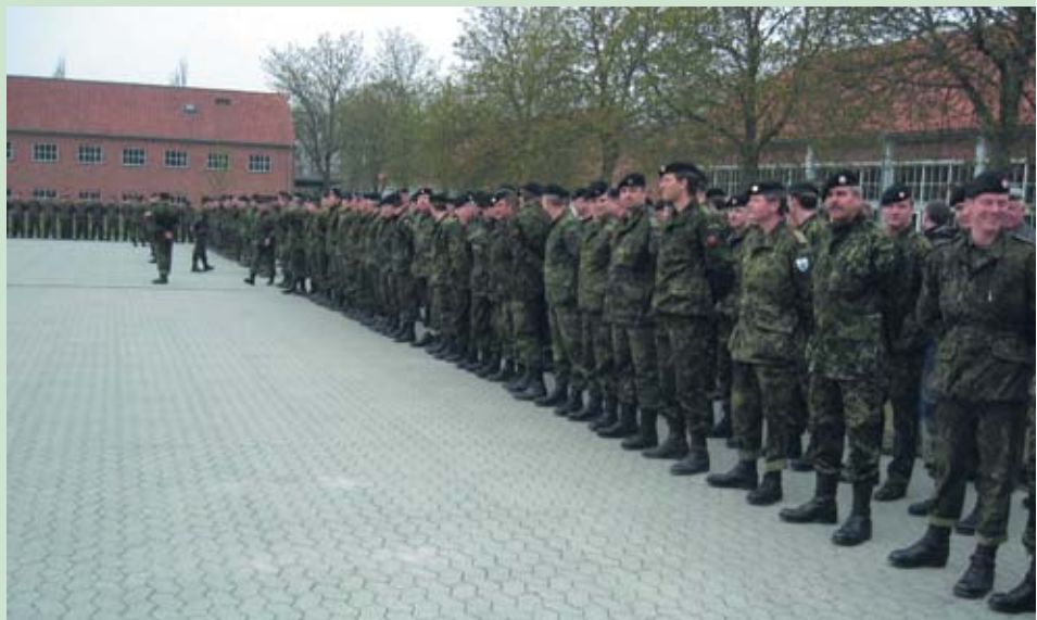
220 reservister gør klar til parade