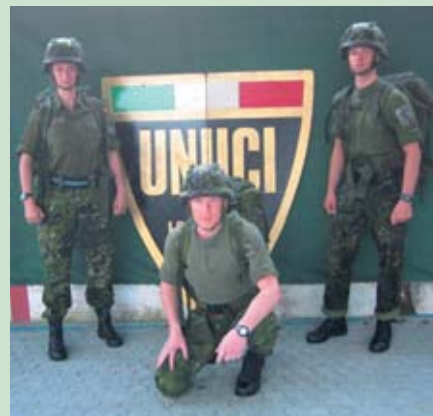
De to danske hold blev placeret som nummer 25 med 1479 point og nummer 35 med 1406 point.

Endelig fremme og efter at have meldt vores ankomst, var det ud på hotellet, pakke ud, pakke om og tilbage til flaghejsning på byens torv. Og bagefter var der lige tid til en italiensk is... De to holdkaptajner for henholdsvis Danmark 1 og Danmark 2 tog til briefing vedrørende morgendagens briefing. De var tilbage på hotellet omkring kl. 23.00, hvor vi, de resterende medlemmer, blev briefet op. Vi fik udleveret en befaling, hvor det var vores "Falco 3" opgave at patruljere langs "Route Silver". Vi skulle være opmærksomme på mindre fjendestyrker i området, som ville være bevæbnet med alt fra