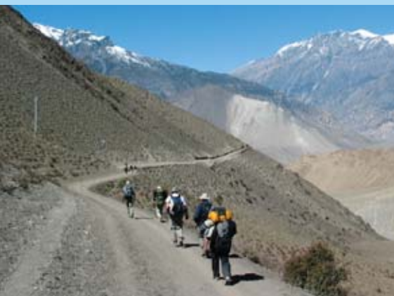
På nogle strækninger var stierne ganske gode og brede, men oftest på skråninger og klippevægge, og med en fantastisk udsigt.