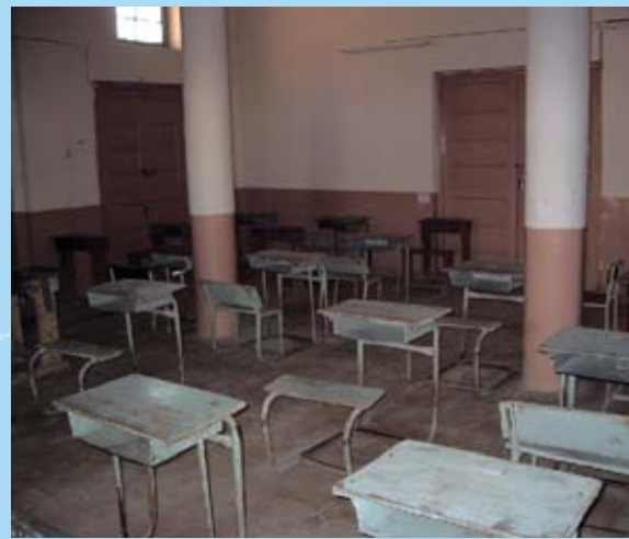
Eksempel på et velholdt klasseværelse i Irak.