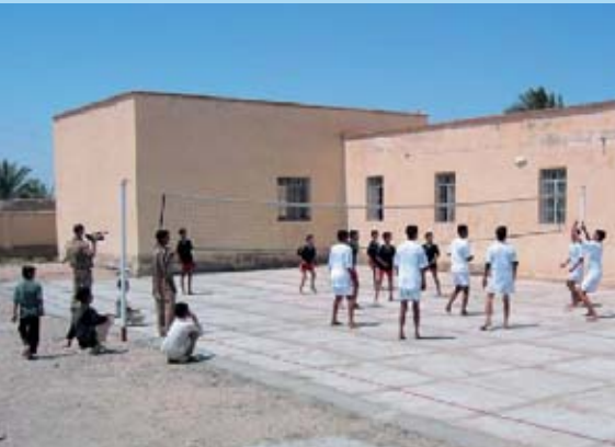
Lokale unge irakere spiller på nyanlagt volleyballbane i tøj indsamlet af to drenge fra Nordjylland.

Irak. Islam. 24 millioner indbygger. 10 gange større end Danmark og fyldt med sand. Hvordan genopbygger man egentlig et land? Det spørgsmål har jeg stillet mig selv rigtig mange gange, og jeg har haft svært ved at svare på det.