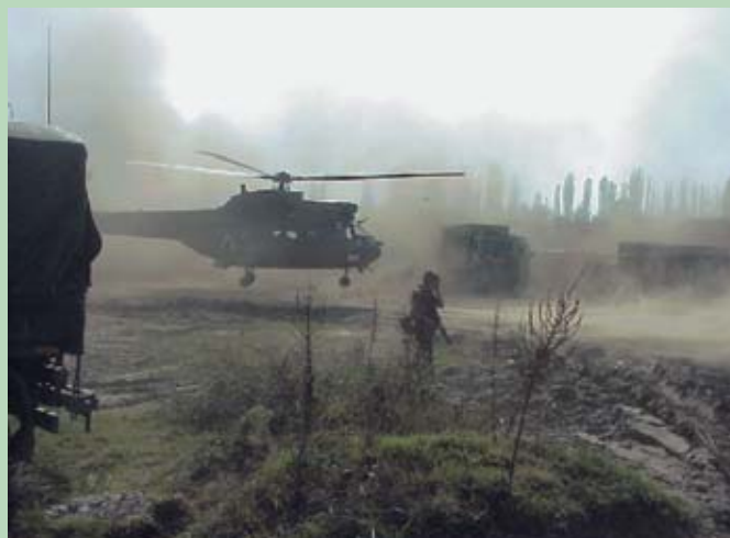
Lad dine faglige kompetencer få et løft. Ansøgningsskemaer kan hentes på ROID hjemmeside.