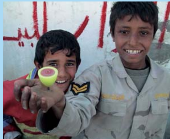
CIMIC ser ud til at blive den enhedstype, der fremover forbinder udenrigs- og forsvarspolitikken i Danmark. I løbet af den kommende forligsperiode skal enhedens nærmere størrelse og opgaver evalueres og forventeligt udbygges.

udførelse af CIMIC-aktiviteter. Enheden kan samtidigt afgive op til tre CIMIC-elementer og kan opretholde en kapacitet svarende til ét CIMIC-element i ét missionsområde (pt. Irak). Enheden er på 14/30 dages beredskab.