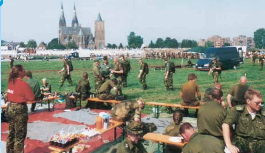
Rasteplads 2 på tredjedagen ved pontonbroen ved kirken i Cuyk.

Arbejdsgruppen modtager gerne henvendelser fra officerer, der kunne tænke sig at deltage i arbejdet, evt. indtræde i arbejdsgruppen, samt naturligvis deltage i marchen; det er såmænd kun et marathondag i fire på hinanden følgende dage – en stor oplevelse – især når målstregen er passeret på fjerdedagen.