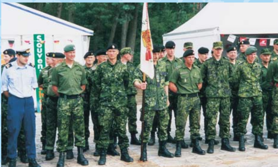
Flagparade. Et udsnit af de 470 danske deltagere på Nijmegen march 2004.