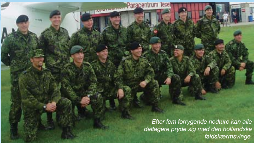
Efter fem forrygende nedture kan alle deltagere pryde sig med den hollandske faldskærmsvinge.