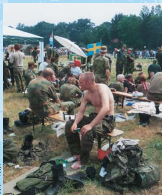
Fællesnordisk rasteplads. Der plejes og forplejes.