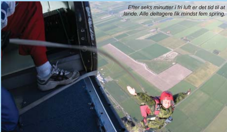
Efter seks minutter i fri luft er det tid til at lande. Alle deltagere fik mindst fem spring.

Flere af deltagere var dog ikke blevet mætte efter de fem obligatoriske spring, og både onsdag aften og torsdag blev brugt til flere spring; heriblandt frit fald fra fire kilometers højde. Torsdag aften kunne sidste mand så lægge faldskærmen på plads i hangaren og køre tilbage til Danmark – en faldskærmsvinge og en fantastisk oplevelse rigere.