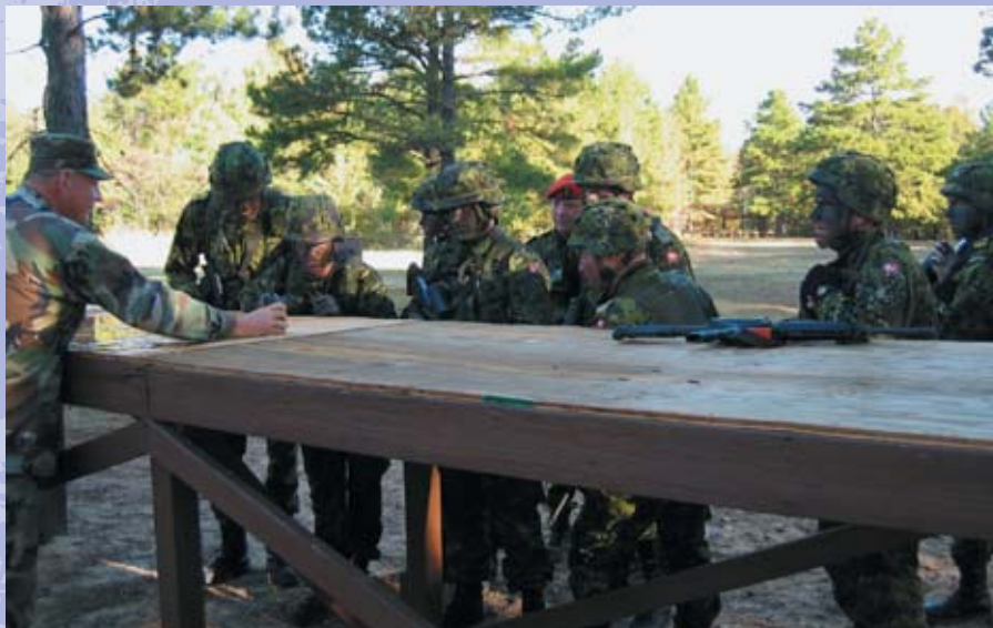
Briefing om rute og forhindringer der skal gennemføres som »combat« under én af konkurrencerne. Der løbes med skarp i geværene fra start til slut.

altid at være 100 % klar til hurtig indsættelse, hvorend i verden der skulle opstå behov for det. Hos dem er der ingen opgaver der er ens, og derfor gør de også ekstremt meget ud af, at deres udstyr og våben er tilpasset den aktuelle opgave. Dette og meget mere mener jeg bestemt dansk forsvar burde tage ved lære af.