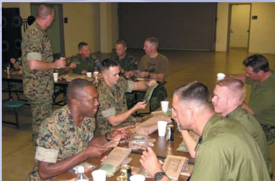
Her er vi i gang med »gallamiddagen« under besøget hos U.S. Marine Reserve Center for staten Arkansas.

Opholdet var koncentreret omkring USMC's specialenhed Raids and Recon , hvor vi fik dyb indsigt i, hvad der kræves af den enkelte soldat og hans udstyr for