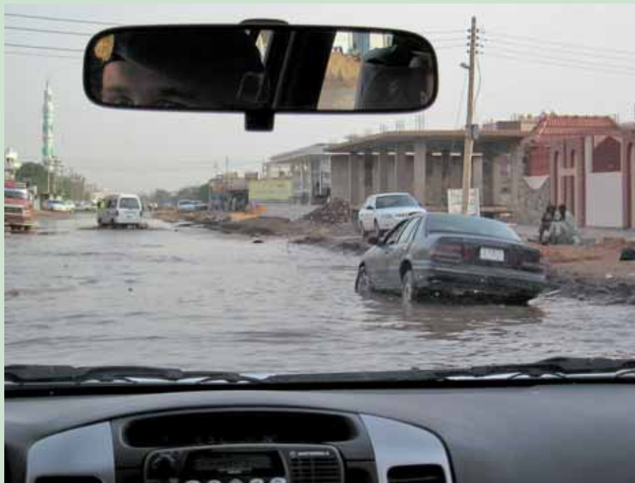
Gadebillede i Khartoum, Sudan.

Udover de 10.000 fredsbevarende soldater, opererer 750 officerer som FN-observatører – et tal, der i løbet af de kommende måneder skal reduceres til 625 officerer. Blandt FN-observatørerne finder vi ti yderst erfarne officerer af såvel linien som reserven fra Danmark. Disse er i dag fordelt på Team Sites i fem af de seks sektorer i den sydlige del af Sudan, hvor UNMIS er deployeret. Planen fastholder styrkebidraget af danske FN-observatører, hvor den næste store rotation vil finde sted i løbet af juni/juli 2007. De militære opgaver er primært koncentreret omkring monitorering af implementeringen af fredsaftalen – eventuelt undersøgelse af overtrædelser deraf! Som udgangspunkt er der tale om en kapitel VI-operation, jf. FN-pagten (egentlige fredsbevarende operationer). Ingen må dog være i tvivl om, at det givne FN-mandat åbner mulighed for anvendelse af magt i