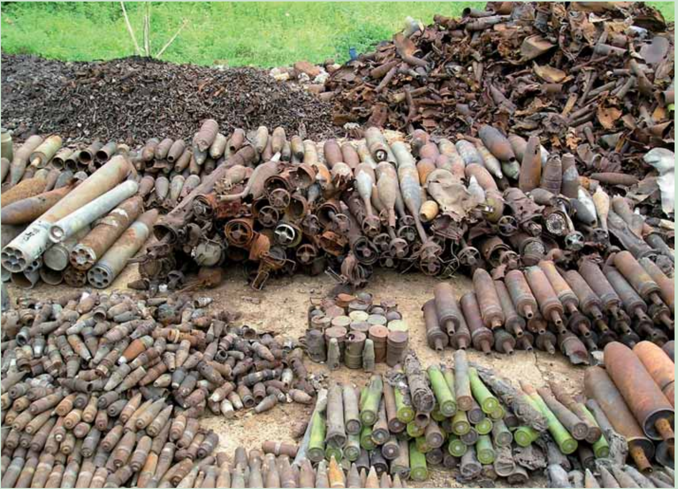
Våben- og ammunitionsopsamlingsplads i Wau, Sudan.

mødes man af mange forskellige miljøer. Der er de skønneste og mest fantasifulde bjergtinder, som får l'Alpe d'Huez til at ligne det rene ingenting. Der er grønne områder med gode vækstmuligheder. Der er sumpområder, som gør, at ens uniform aldrig føles tør, hvis den da ikke når at rådne op på en Tour of Duty; og selvfølgelig er der den gølge ørken. Sudan indeholder bare al den mangfoldighed, man kan ønske sig.