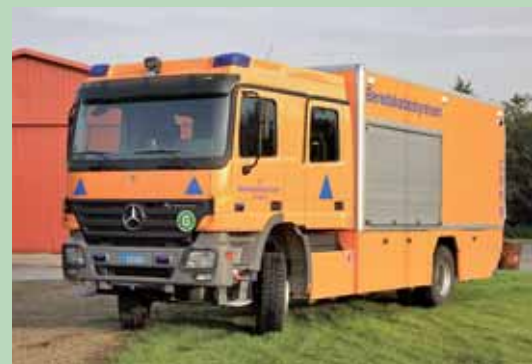
Beredskabsstyrelsens CBRN køretøj

Som en del af det niveaudelte beredskab skal det statslige redningsberedskab fremstå som en rettidig og kompetent deltager i samfundets beredskab ved større ulykker og katastrofer, herunder terrorhandlinger. Det statslige redningsberedskab vil være førende i udvikling af indsatskoncepter over for større ulykker, katastrofer og terrorhændelser, såvel nationalt som internationalt.