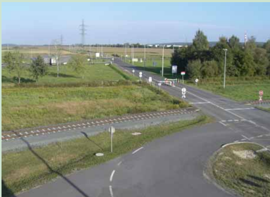
Eksempel på grænseovergang til Ungarn. Området var jævnt uden større højdeforskelle, men med meget buskads og mange åer og bække, stier og småveje og ikke mindst megen trafik på hverdage.

Dette blev også tydeligt i blandt andet en orientering om det Østrigske forsvars omstruktureringer: Som mange andre steder arbejder man på