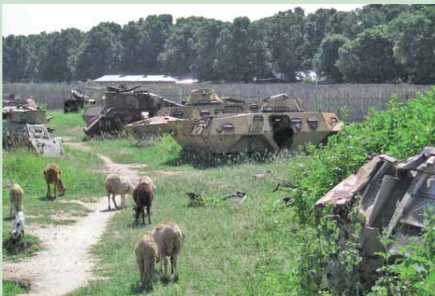
Panserkirkegård i Juba, Sudan.

At beskrive Sudan med få ord lader sig ikke gøre. Landet er ganske enkelt kompleks i yderste potens. Sikkert er det dog, at Sudan er mere end blot den ulykkelige situation i Darfur-regionen. Hovedstaden kan nok bedst beskrives som "en anden afrikansk hovedstad" med alle de goder og forbandedelser, der hviler over en hovedstad i Afrika. Mangfoldigheden er der, og den respekteres og accepteres. Tager man udenfor hovedstaden,