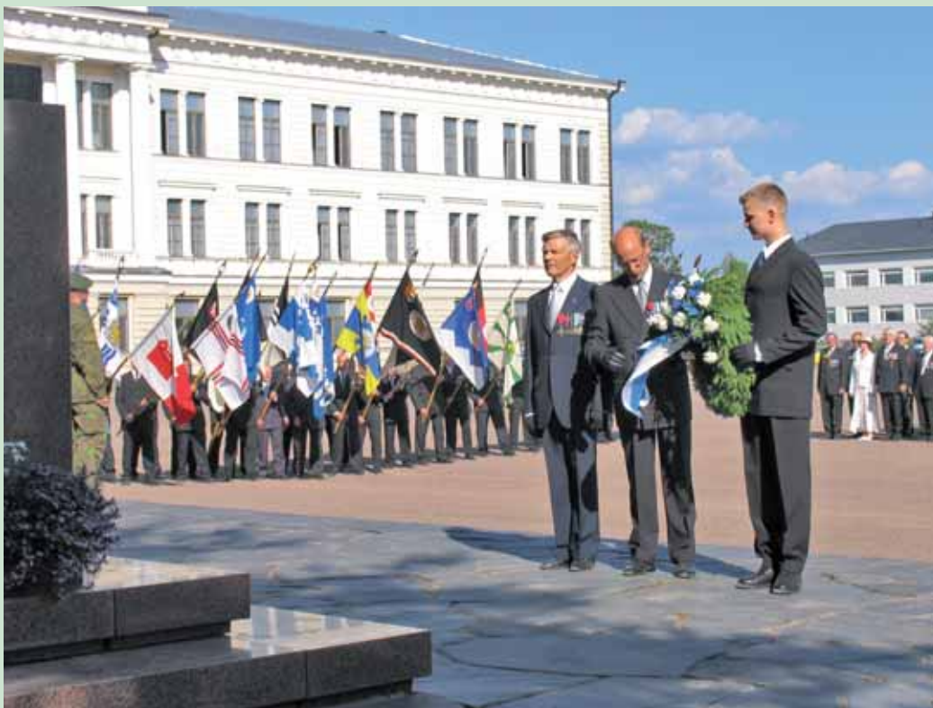
Kransenedlæggelse ved krigsmonumentet foran Reserveofficersskolen i Hamina

Den finske "SISU" er en imponerende "størrelse": Kendetegnet ved vilje, nationalfølelse og udholdenhed, og er helt klart en bærende kraft for forsvaret generelt. Ingen ser det som en dårlig karriere, eller mangel på samme, at en mand er infanteridlingsfører i grænsetropperne i 25 år og stadig sekondløjtnant – alle betragter det som en "absolut ære at få lov til at forsvare fædrelandet" – og de samme personer deltager typisk i cirka en måneds militær træning/uddannelse/øvelser hvert år.