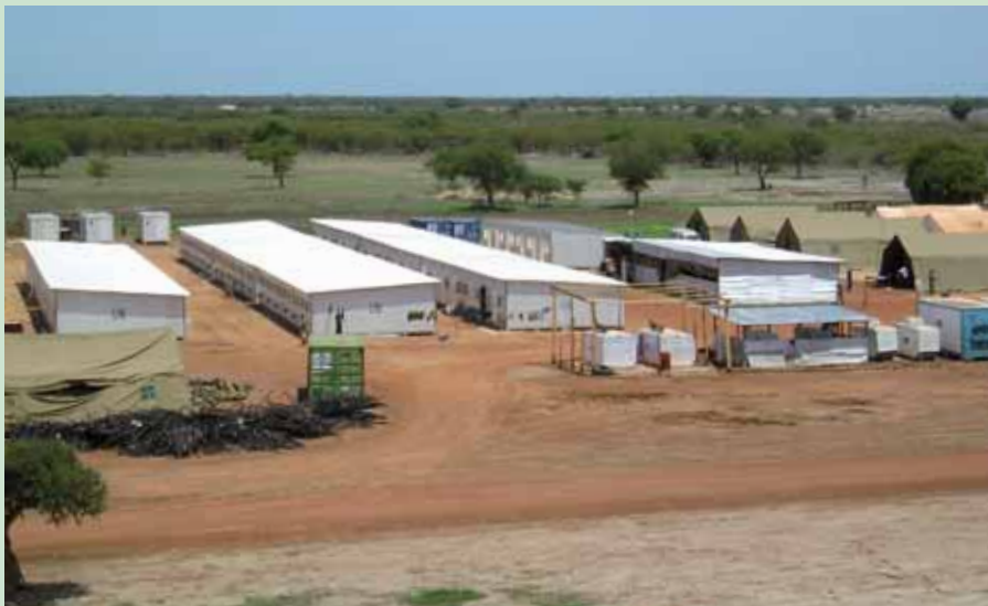
FN-lejr i Abyei, Sudan.