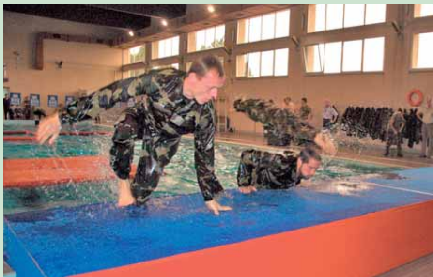
Tre mand om en svømmeforhindringsbane kræver en del planlægning.

I CIOR-udgaven er den klassiske militære femkamp modificeret noget.