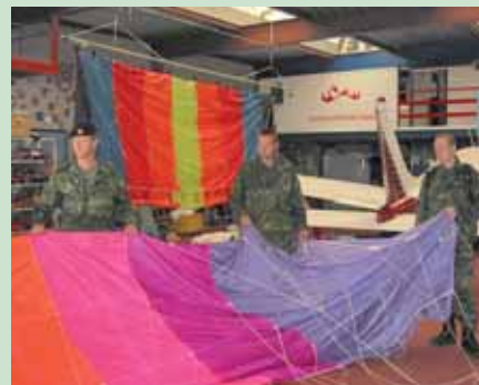
Der lyttes koncentreret til instruktørens beskrivelse af faldskærmen. Al undervisning foregik på engelsk.

En hel eftermiddag blev brugt på at se amerikanske film med hollandske undertekster og tømme stedets lille automat for kaffe og varm kakao.