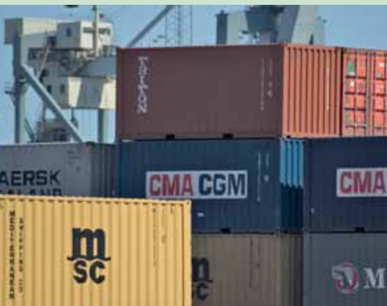
I US Navy Reserve Civil Maritime Industry Group (CMIG), bruger reserveofficerer deres civile maritime kompetencer til at forebygge terrorangreb, for eksempel ved analyse af mønstre i containertransport.

sternes omkostningseffektivitet, lokal-kendskab og specialiserede civile kompetencer, som kun vanskeligt vil kunne opbygges hos militært fastansatte.