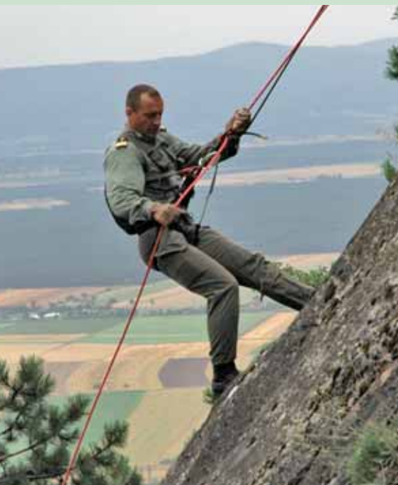
Rapelling på tid under militær konkurrence i Østrig.

Konkurrencerne består af flere discipliner, normalt bygget op omkring løb, mountainbiking, cykling krydret med momenter i kano eller kajak samt svømning eller vandpassage. Under denne konkurrenceform er der vid mulighed for at udfordre sin fysik, samarbejdsevne og orienteringsevner. Alt sammen gode færdigheder der kan anvendes civilt som militært.