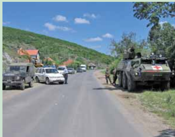
Afspærring ved militærpolitiets foranstaltning efter fundet af to granater fra krigens tid nær en befærdet vej. Man er i færd med at demontere granaterne.

Det kan nævnes, at der var en baltisk stabsofficer, der som forbindelsesofficer under besøg af italienske enheder ikke kunne dy sig, og regnede forkert m.h.t. de maks. tre genstande i