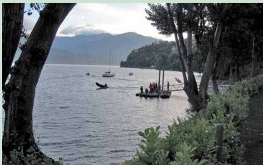
Starten ser harmløs ud - en tur i gummibåd. Mod Schweiz af Lago Maggiore.

Alt i alt klarer de danske hold turen på cirka syv timer, hvilket rækker til placeringer som nr. 22 og 41 ud af 71 hold, når vores point tælles sammen. Her skal det siges, at det er ganske svært at læse op på teorien hjemmefra, da de italienske instruktioner ikke ligefrem er letforståelige, men på trods af en noget mangelfuld teori-del, klarer begge danske hold sig rigtigt pænt på rutinen, og får i hvert fald en forrygende oplevelse med hjem.