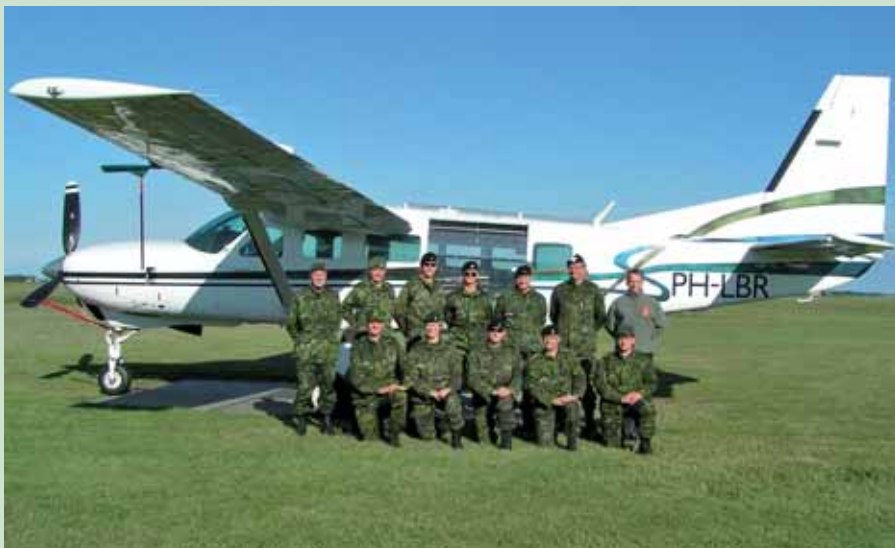
De tolv deltagere på dette års faldskærmskursus i Holland.