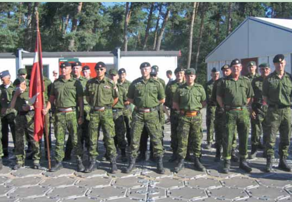
I lejren var mere end 550 danske militære marchdeltagere klar til den danske parade opstillet i U-form. Fra HPRD deltog sytten medlemme.

Nijmegen-marchen bliver "finere og finere", forstået på den måde, at man kun får medaljen for at være "soldat med støvler på" ved på fire dage at gå 40 kilometer hver dag; hvis man er under 50 år, da med ti kilo oppakning. Der er dermed langt fra Den Livlige Kongegardes "perron-medaljer", som man får, hver gang et fremmed stats-overhoved besøger Danmark.