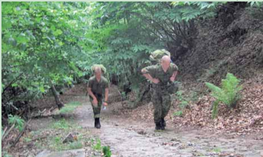
Så går det løs - 1000 højdemeter på en 4 km strækning. Det ene danske hold tager den i mørke.

36 timer før forlader vi, seks reservister, Svanemøllen Kaserne i en tæt-pakket BUSLET. Schweiz sidder som en alpehue trukket ned om ørene på det italienske Lombardiet - og som bekendt må NATO-personel ikke passere gennem Schweiz uden særlig tilladelse, hvilket forlænger turen til næsten 19 timer.