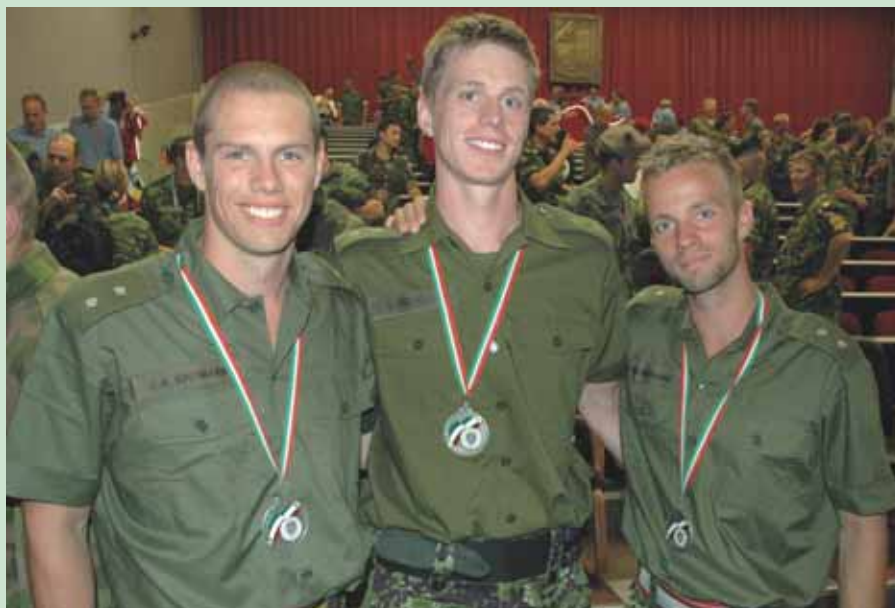
Det stolte novice-hold behængt med sølvmedaljer.

Dansk deltagelse på guldholdet i klassen