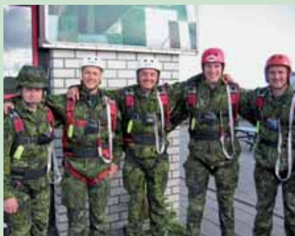
Fem af deltagerne klar til deres første spring. Bag de fem ses oversigtskortet over landingsområdet, hvorpå der bliver illustreret, fra hvilken vinkel man skal begynde sin indflyvning.

Den aften var der meget stille i det lille selskab. Der blev regnet på, hvor mange, der kunne blive, hvis onsdag viste sig også at komme med dårligt vejr. Hjemrejsen var sat til torsdag, og alle ville gerne springe, inden de tog hjem til Danmark igen.