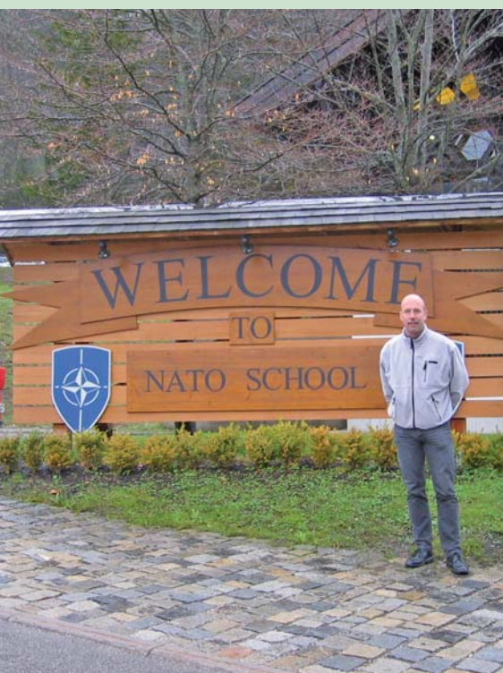
Artiklens forfatter ved NATO skolens velkomstkilt

Uddannelserne er naturligvis med rejseomkostninger dækket og indkommandering. God fornøjelse.