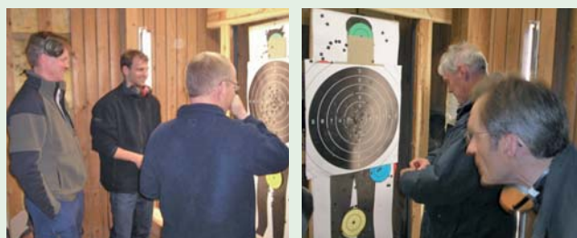
Kredskydninger på Politigården i Vejle

TIR 17 JUN ONS 20 AUG TIR 02 SEP ONS 17 SEP